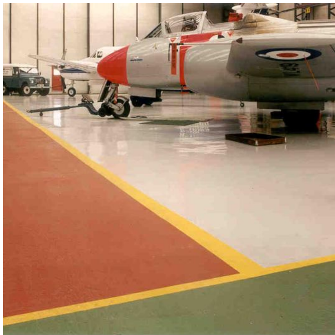
Gama standardowych kolorów