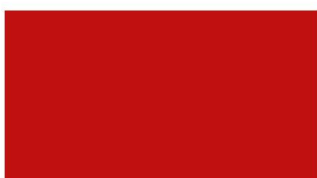
Czerwony (zbliżony do RAL 3020)