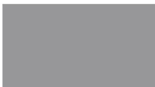
Szary (zbliżony do RAL 7004)

Kolory przedstawione powyżej mogą nieznacznie odbiegać od rzeczywistych. W celu otrzymania próbek w rzeczywistych kolorach lub zamówienia specjalnego koloru prosimy o skontaktowanie z Działem Obsługi Klienta.