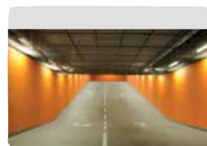
4 Rampy wewnętrzne