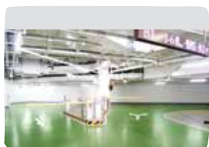
2 Kondygnacje pośrednie