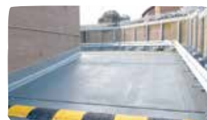
3 Rampy zewnętrzne