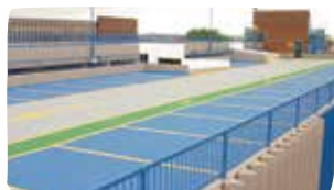
1 Kondygnacje niezadaszone